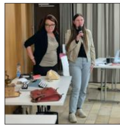
... am Buffet des Angehörigenachmittags